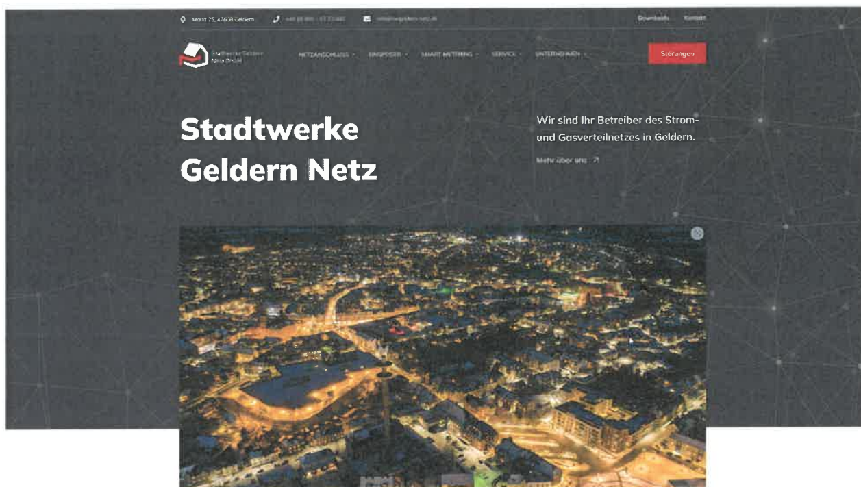
Abbildung 2: Internetauftritt der Stadtwerke Geldern Netz GmbH